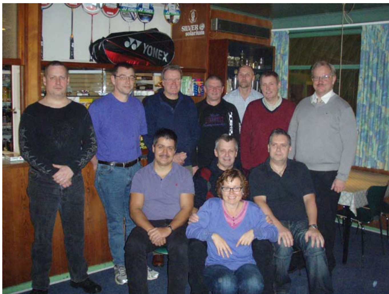
Nogen af de glade spillere i Århus - Eller rettere i Brabrand!