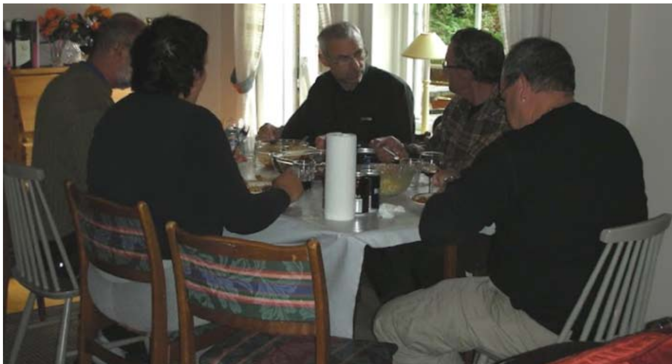
Der blev også tid yil at hygge indendøre i tørvejr.