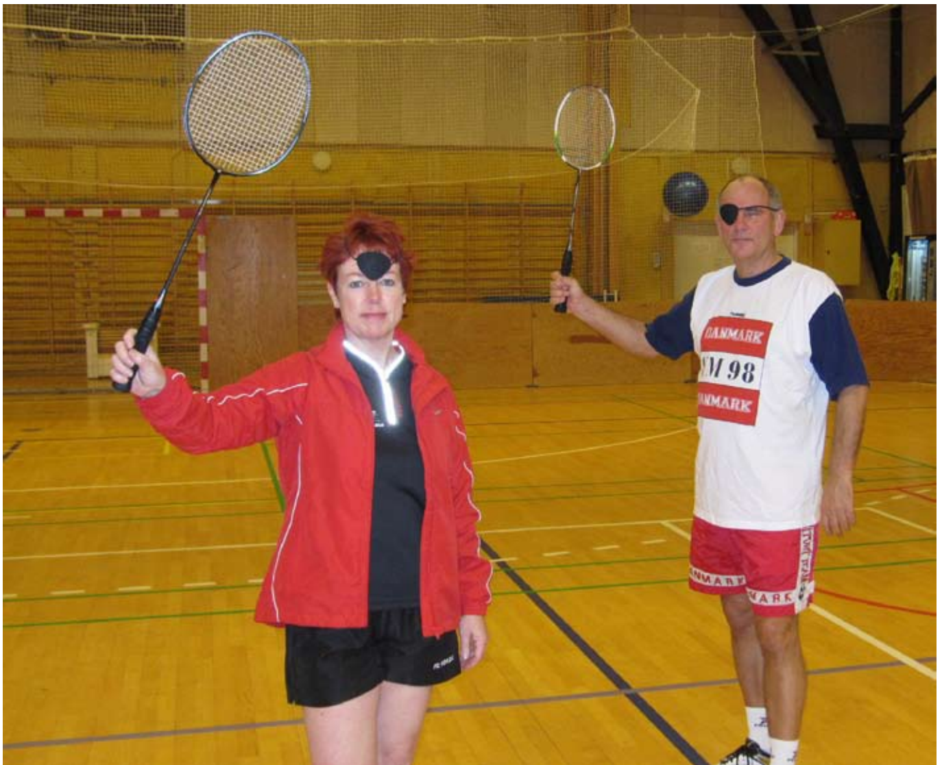
Klar til kamp "A lá Kaptajn Klo"